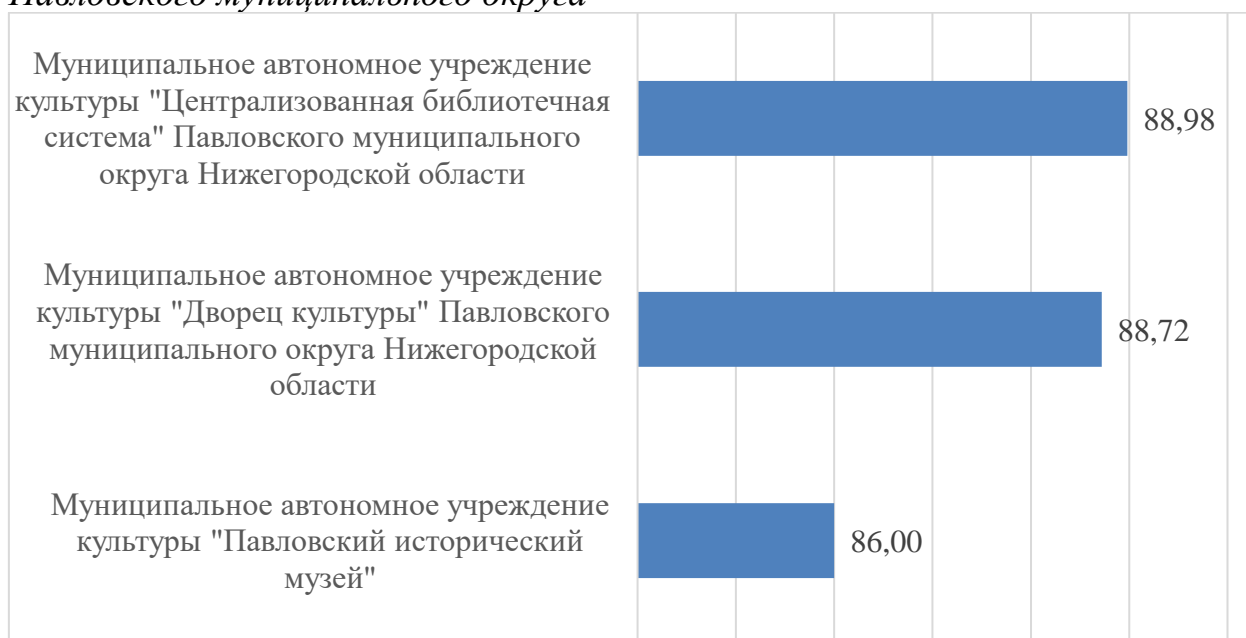
Гистограмма 1. Рейтинг по результатам сбора, обобщения и анализа информации о качестве условий оказания услуг организациями культуры Павловского муниципального округа