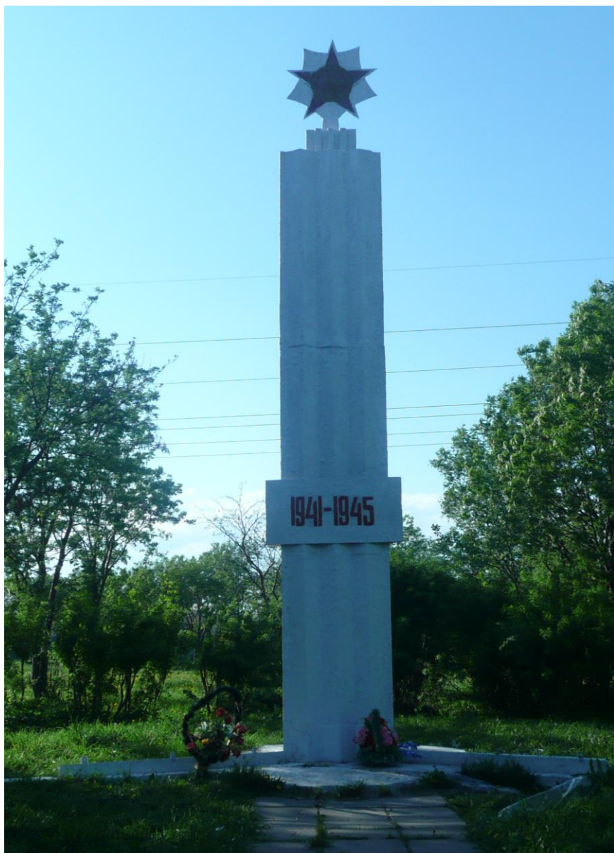
Памятник всем погибшим воинам в Рябиновой роще